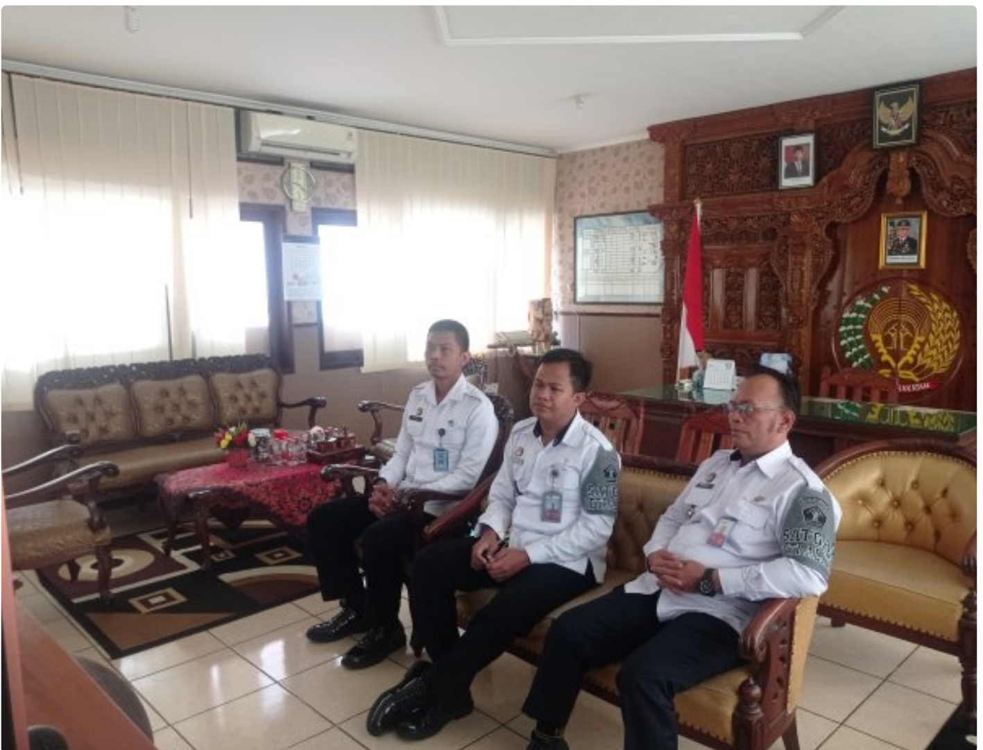
Rutan Blora Bergabung Dalam Giat Zoom Reformasi Birokrasi

Blora - Reformasi birokrasi merupakan sebuah kebutuhan yang perlu dipenuhi dalam rangka memastikan terciptanya perbaikan tata kelola pemerintahan, serta tata kelola pemerintahan yang baik adalah prasyarat utama pembangunan