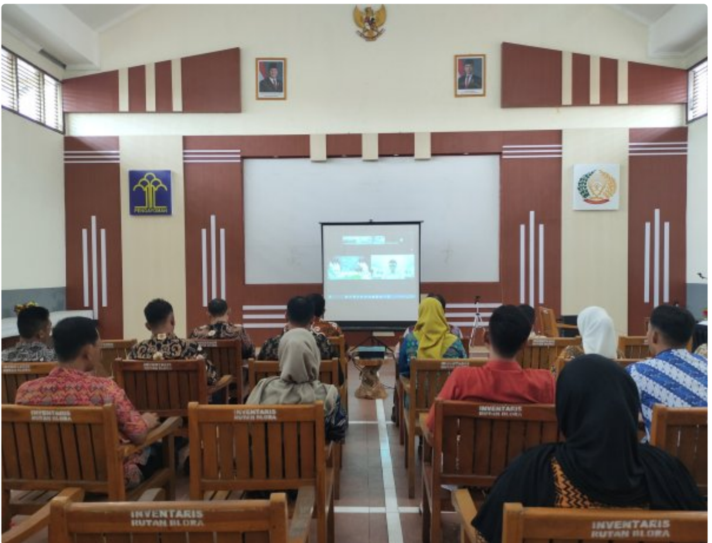
ASN Rutan blora ikuti pengarahan menteri kemenimipas

Blora - Rumah Tahanan Negara (Rutan) Kelas IIB Blora melaksanakan kegiatan pengarahan yang disampaikan langsung oleh Menteri Imigrasi dan Pemasarakatan, Agus Andrianto. Kegiatan ini diikuti oleh seluruh ASN di